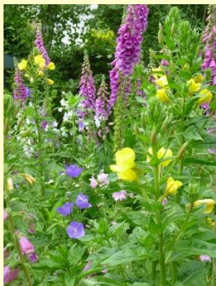
Blütenpracht im Naturgarten

14:00 bis 18:00 Uhr: Fünf Halstenbeker Familien öffnen Ihre naturnah gestalteten Gärten.